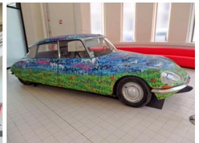
4 – 5 – 6 – 7 : Garage Citroën