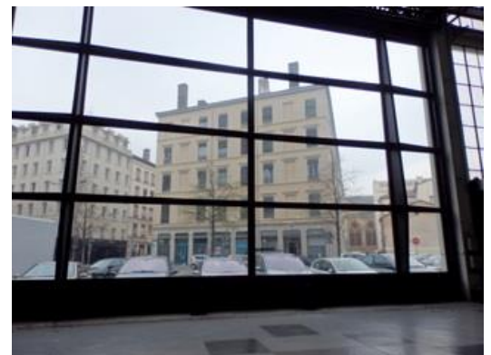
11 – 12 – 13 : Garage Citroën