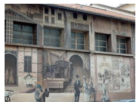
17 – 18 – 19 : le mur de l'histoire des transports lyonnais