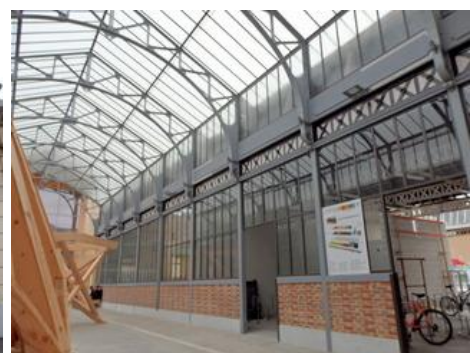
20 – mur de l'histoire des TCL 21 – 22 : Ch. Feuillat bâtiments industriels Rochet-Schneider