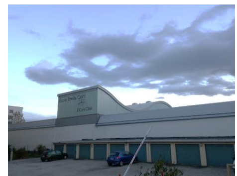
23 – 24 – 25 : Chemin Feuillat bâtiments industriels Rochet-Schneider