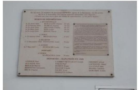
1 – 2 – 3 : Garage Citroën